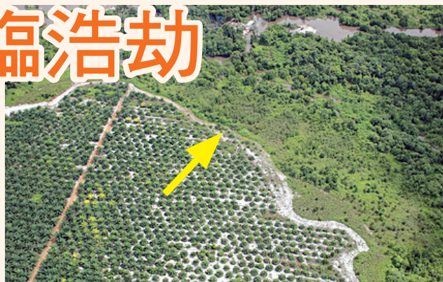
▲為了生產大量棕櫚油，圖中棕櫚樹種植面積逐年擴大（箭頭處），右上方的原始雨林能不能守住，要看消費者的選擇。

替代能源。由於使用生質能源可降低對化石燃料的依賴，加上中國大陸與印度對食用油的需求量增加，因此，印尼栽種棕櫚樹的面積迅速擴大，甚至侵吞境內（及鄰國馬來西亞）的熱帶雨林。